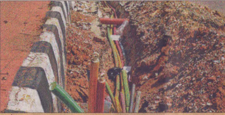
ಪ್ರಸ್ತುತ ದಿನ ನಿತ್ಯದ ಜೀವನದಲ್ಲಿ ಬ್ರಾಡ್‌ಬ್ಯಾಂಡ್ ಸೇವೆ ಜನರಿಗೆ ಅತ್ಯವಶ್ಯಕ ಎನಿಸಿಕೊಂಡಿದೆ. ಹೀಗಾಗಿ ಅಂತರ್ಜಾಲ ಬಳಕೆದಾರರಿಗೆ ಸಮಸ್ಯೆ ಉಂಟಾಗಬಾರದು ಎಂಬ ಕಾರಣಕ್ಕೆ ಕಂಪನಿಗಳ ವಿರುದ್ಧ ಏಕಾಏಕಿ ಕ್ರಮ ಕೈಗೊಳ್ಳುತ್ತಿಲ್ಲ. ಮುಖ್ಯ ಕಾರ್ಯದರ್ಶಿಗಳು ಸಹ ಕ್ರಿಮಿನಲ್ ದೂರು ದಾಖಲಿಸದಂತೆ ಹೇಳಿದ್ದಾರೆ.

ಇದೀಗ ಅಂತಿಮ ಗಡುವು ಮುಗಿದಿದೆಯಾದರೂ ಬಿಬಿಎಂಪಿ ಯಾವುದೇ ಕ್ರಮಕೈ ಮುಂದಾಗಿಲ್ಲ. ಕನಿಷ್ಠ ಎಚ್ಚರಿಕೆ ನೋಟಿಸ್ ಕೂಡ ಜಾರಿ ಮಾಡಿಲ್ಲ. ಹೀಗಾಗಿ ಕಳೆದ ಒಂದು ದಶಕದಿಂದ ಬಿಬಿಎಂಪಿಗೆ ಕೋಟ್ಯಂತರ ರೂ. ವಂಚಿಸಿರುವ ಕಂಪನಿಗಳ ಬಗ್ಗೆ ಬಿಬಿಎಂಪಿ